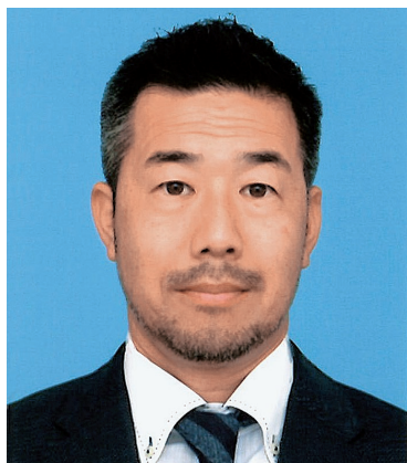
ロータリー財団委員会 補助金委員会副委員長