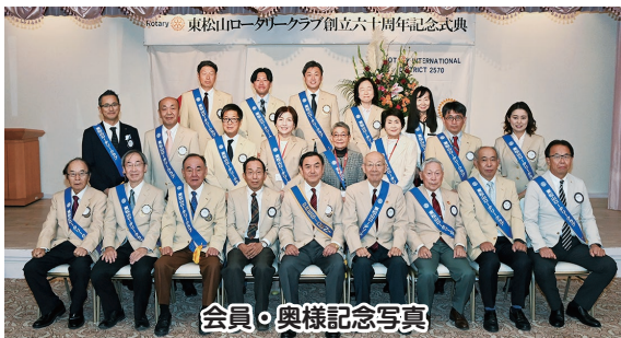
会員・奥様記念写真

私たちは、昨年の4月28日に会員半数の12名（途中で1名逝去）で実行委員会を立ち上げ、今日まで鋭意準備を進めました。その理念を「ロータリーの力を結集し、明るく楽しい事業を実施する」とし、7つの事業を企画しメインが記念式典でした。ご参加いただきました皆様には、60年にわたるご指導ご鞭撻に感謝を申し上げ、新しい60年に向かい一歩が踏み出せたと喜んでいきます。