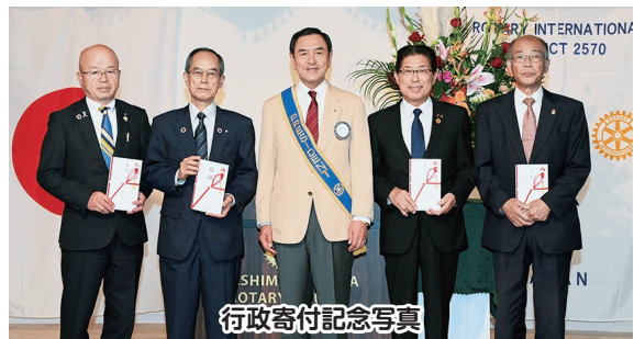
行政寄付記念写真