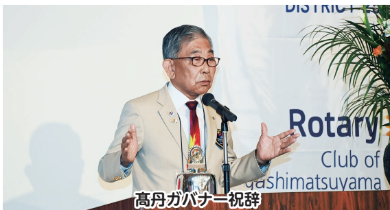
高丹ガバナー祝辞